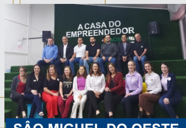
SÃO MIGUEL DO OESTE