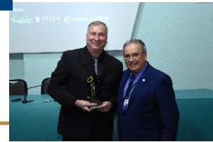
Socin Centro Contábil (Indaial)

Na cerimônia, realizada na sede da entidade, em Florianópolis, também foi entregue a homenagem Pioneiros da Contabilidade aos profissionais da contabilidade e organização contábil com registro mais antigo no CRCSC (confira acima). Foram entregues, ainda, placas aos primeiros colocados nas duas edições do Exame de Suficiência de 2023.